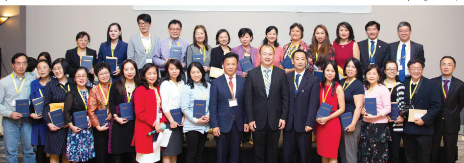
59 名教师喜获国侨办的“华文教师培训证书”