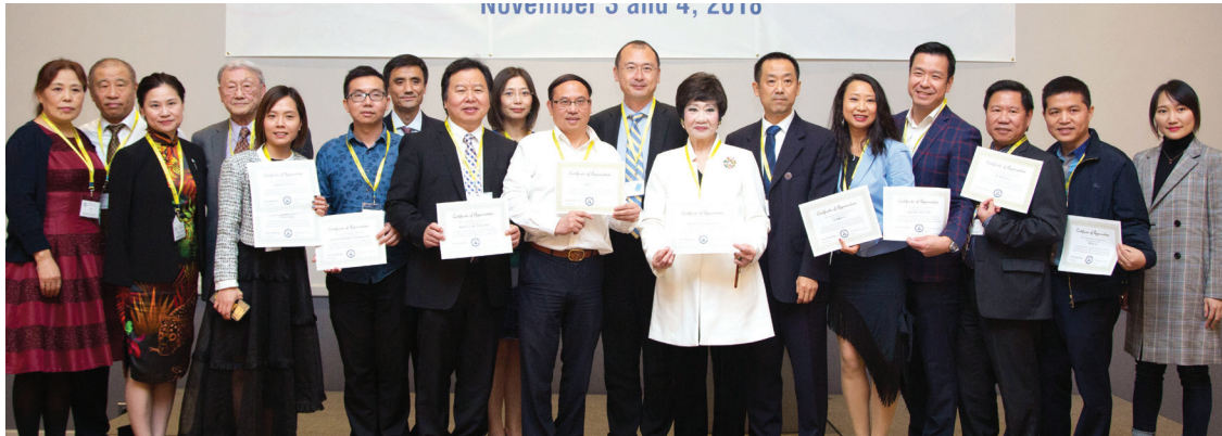
获得赞助荣誉证书的嘉宾颁发仪式