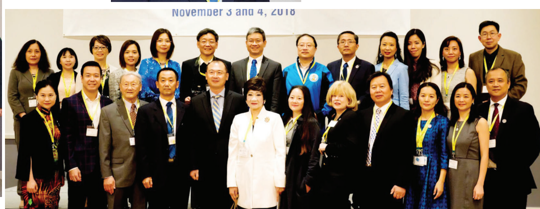
年会受邀嘉宾合影