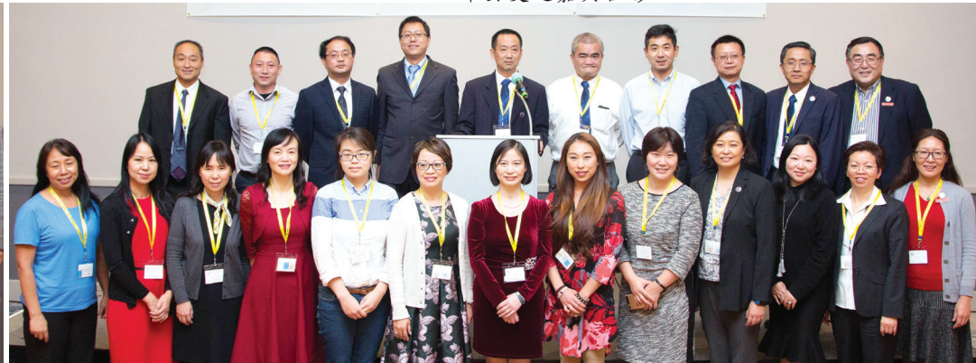
华夏 22 所分校负责人全家福