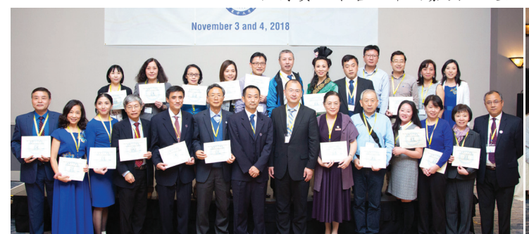
表彰 25 名华夏优秀义工